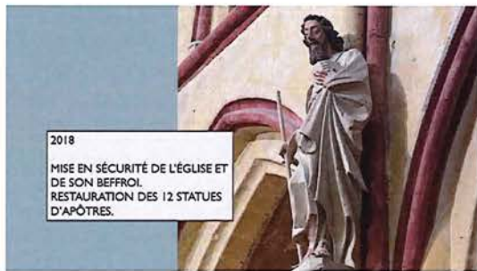
2018 MISE EN SÉCURITÉ DE L'ÉGLISE ET DE SON BEFFROI. RESTAURATION DES 12 STATUES D'APÔTRES.