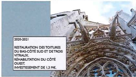
2020-2021 RESTAURATION DES TOITURES DU BAS-CÔTÉ SUD ET DE TROIS VITRAUX. RÉHABILITATION DU CÔTÉ OUEST. INVESTISSEMENT DE 1,3 M€.