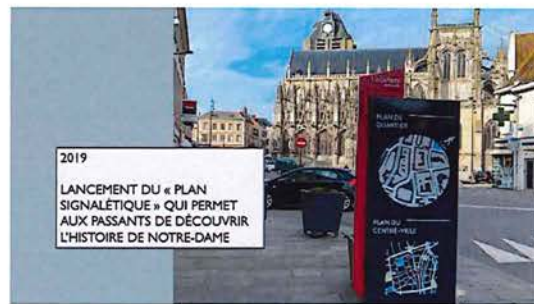
2019 LANCEMENT DU « PLAN SIGNALÉTIQUE » QUI PERMET AUX PASSANTS DE DÉCOUVRIR L'HISTOIRE DE NOTRE-DAME