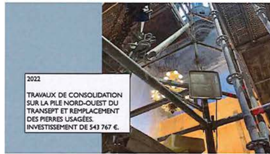
2022 TRAVAUX DE CONSOLIDATION SUR LA PILE NORD-OUEST DU TRANSEPT ET REMPLACEMENT DES PIERRES USAGÉES. INVESTISSEMENT DE 543 767 €.